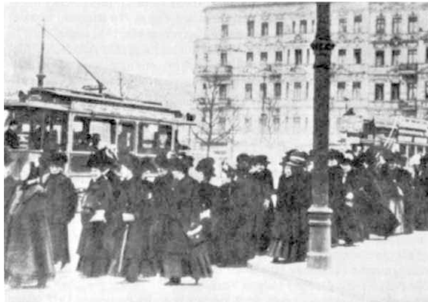
Demonstration zum Internationalen Frauentag in Berlin 1911

Aussage eines männlichen Delegierten der SPD auf dem Parteitag 1913: