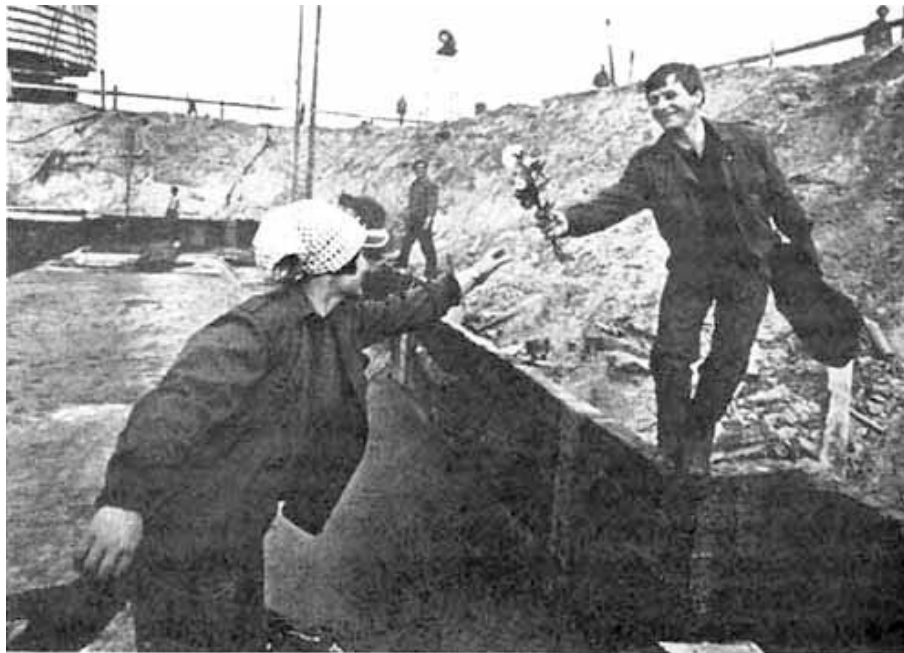
8. März auf einer Baustelle in der DDR

Nach dem 2. Weltkrieg fanden in der sowjetischen Besatzungszone bereits 1946 wieder Feiern zum Frauentag statt. In den sozialistischen Ländern, auch in der DDR, wurde die gesellschaftliche Befreiung der Frau gefeiert. Der Tag wurde mit offiziellen Feiern für die Frauen organisiert, um die sozialen Errungenschaften des Staates für die Frauen herauszustellen.